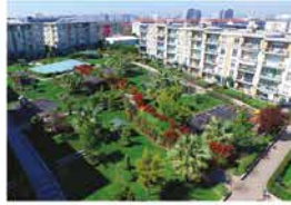
YASEMİN KONAKLARI BAĞÇELİEVLER