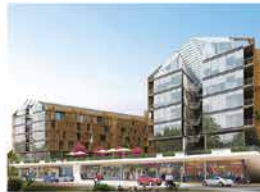
YALIN EVLER GÖKTÜRK