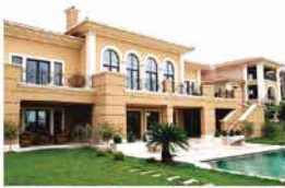
PELİCAN HILL BÜYÜKÇEKMECE