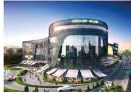
A PLUS ATAKÖY