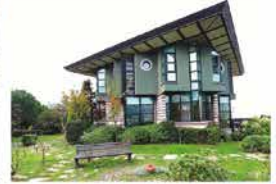
GÜNYÜZÜ KONAKLARI BEYKÖZ