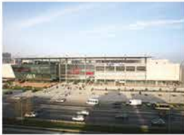
PELİCAN MALL AVCILAR