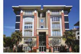
ATAKÖY KONAKLARI ATAKÖY