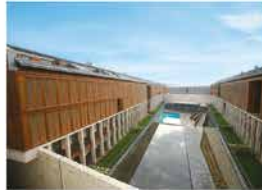
ARKETİP EVLERİ GÖKTÜRK