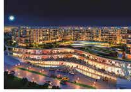
KORU FLORYA FLORYA