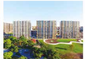
CENNET KORU KÜÇÜKÇEKMECE