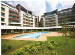
COUNTRY LIFE GÖKTÜRK